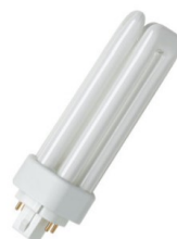
Świetłówki kompaktowe niezintegrowane