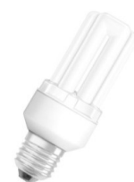
Świetłówki kompaktowe zintegrowane z elektronicznym układem zasilającym